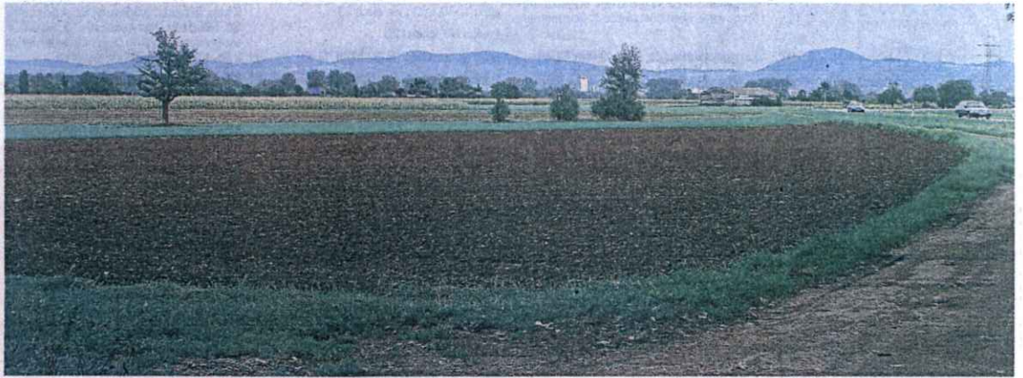
Ein 20 bis 40 Hektar großes Gelände zwischen Autobahn 659 (links) und der L 3111 in Richtung Muckensturm (rechts) hat pfenning logistics als neuen zentralen Standort ins Auge gefasst. Im Rücken des Fotografen ist die Autobahn-Anschlussstelle Viernheim-Ost, im Hintergrund zu sehen ist die Bergstraße.

Eine spannende kommunalpolitische Debatte steht also bevor, in der sich vor allem eine Frage stellt: Was ist die Stadt bereit zu opfern, um eines seiner namhaftesten und größten Unternehmen zu halten?