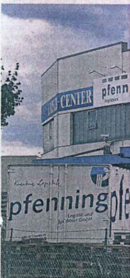
Der Standort in der Lilienthalstraße ist Hauptsitz von pfenning logistics.

■ Der Logistik-Riese beschäftigt rund 1800 Mitarbeiter . Fast 450 von ihnen arbeiten in der Region, das Gros davon in Viernheim. Hier betreibt pfenning logistics beispielsweise ein gigantisches Lager für den Düsseldorf-Henkel-Konzern. Auf rund 1600 Paletten lagern Waschmittel für ganz Südwestdeutschland. bhr