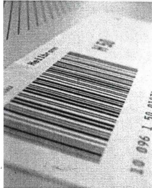
Strichcodes k nnten bald der Vergangenheit angeh ren

Da immer mehr Handelsunternehmen auf RFID umstellen, werden bald auch immer mehr Zulieferer diese Technologie einsetzen. In Deutschland war die REWE-Gruppe das erste Handelsunternehmen, das in einem seiner Distributionslager auf RFID umgestellt hat. Ein Pilotprojekt in Norderstedt im Jahr 2003 hat sich als erfolgreich erwiesen und so hat REWE es auf ein Dutzend Lieferanten und rund 400 Penny-Märkte in Norddeutschland ausgeweitet. Wareneingang, Kommissionierung und Warenausgang werden ausschließlich über RFID abgewickelt. Nun sollen weitere Standorte folgen. (Ende)