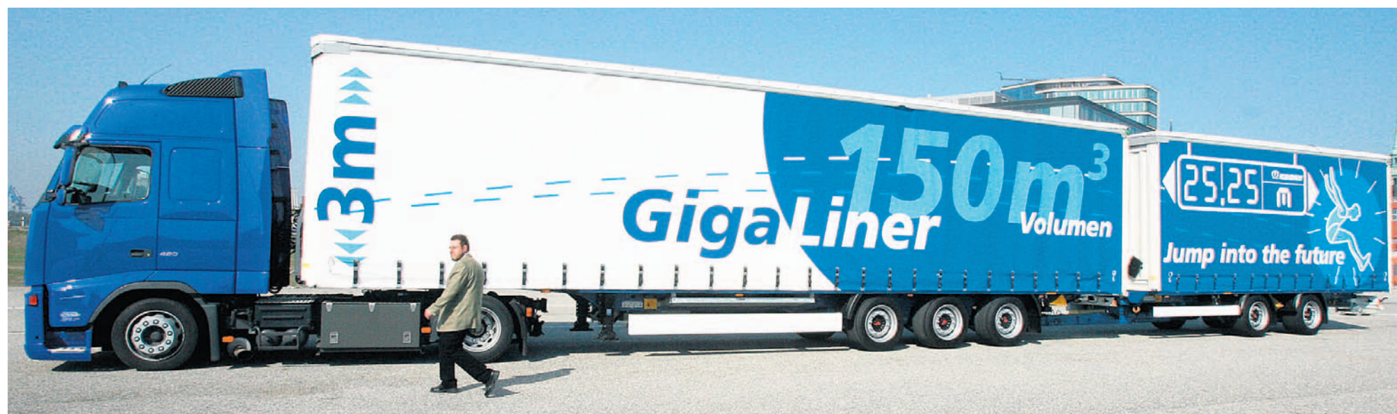
Riesen-Lkw wie diese werden bald auch über deutsche Autobahnen fahren.