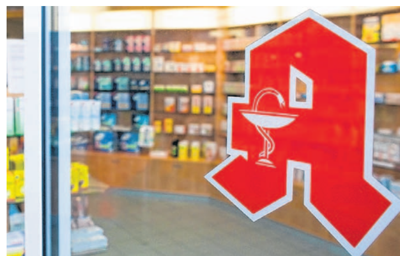
Mit Gutscheinen oder Geschenken mit einem geringen Wert dürfen Apotheken um ihre Kunden buhlen, das hat der BGH beschlossen.

Versandapotheken hoffen hingegen darauf, dass die Preisvorschriften für nicht anwendbar erklärt werden. Das behauptet der Verband der Versandapotheken, würde den Wettbewerb fördern. Die Arzneimittelpreisverordnung reguliert den Preis rezeptpflichtiger Arzneimittel. Patienten sollen das gleiche Arzneimittel in jeder Apotheke zum selben Preis erhalten. Dies, so der Vorsitzende Richter Bornkamm, solle eine flächendeckende Versorgung sicherstellen. „Ob die Preisvorschriften sinnvoll sind, darüber brauchte sich der Senat den Kopf nicht zu zerbrechen“, sagte Bornkamm. dpa