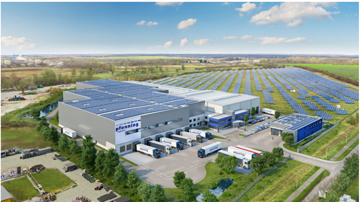
3D-Visualisierung des Multicube Berlin in Herzfelde.

Die Pfenning Logistics Group, familiengeführter Kontraktlogistikdienstleister, hat im Rüdersdorfer Ortsteil Herzfelde mit den Bauaktivitäten des Multicube Berlin begonnen. Auf einem Grundstück von 40.000 Quadratmetern wird die Bestandsimmobilie erweitert und gemäß dem Multicube-Immobilienkonzept entwickelt.