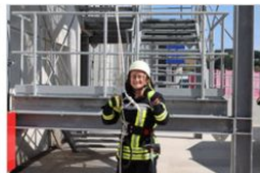
... und auch sie, Daumen hoch