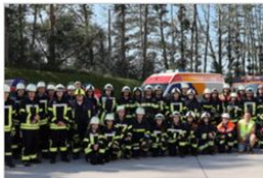
Das Gruppenfoto mit Ausbildern und Helfern