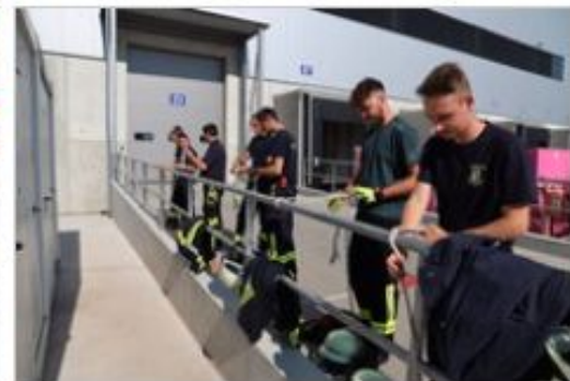
Vor dem Abseilen noch mal den Rettungsknoten üben