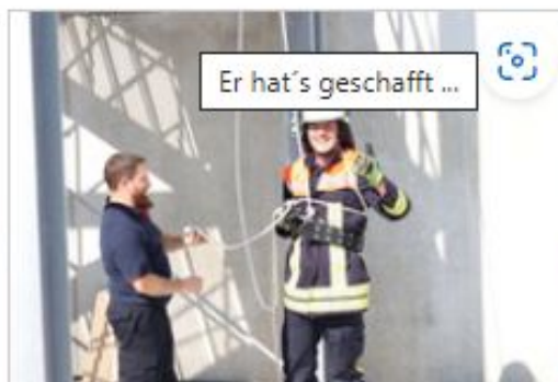
Er hat's geschafft ...